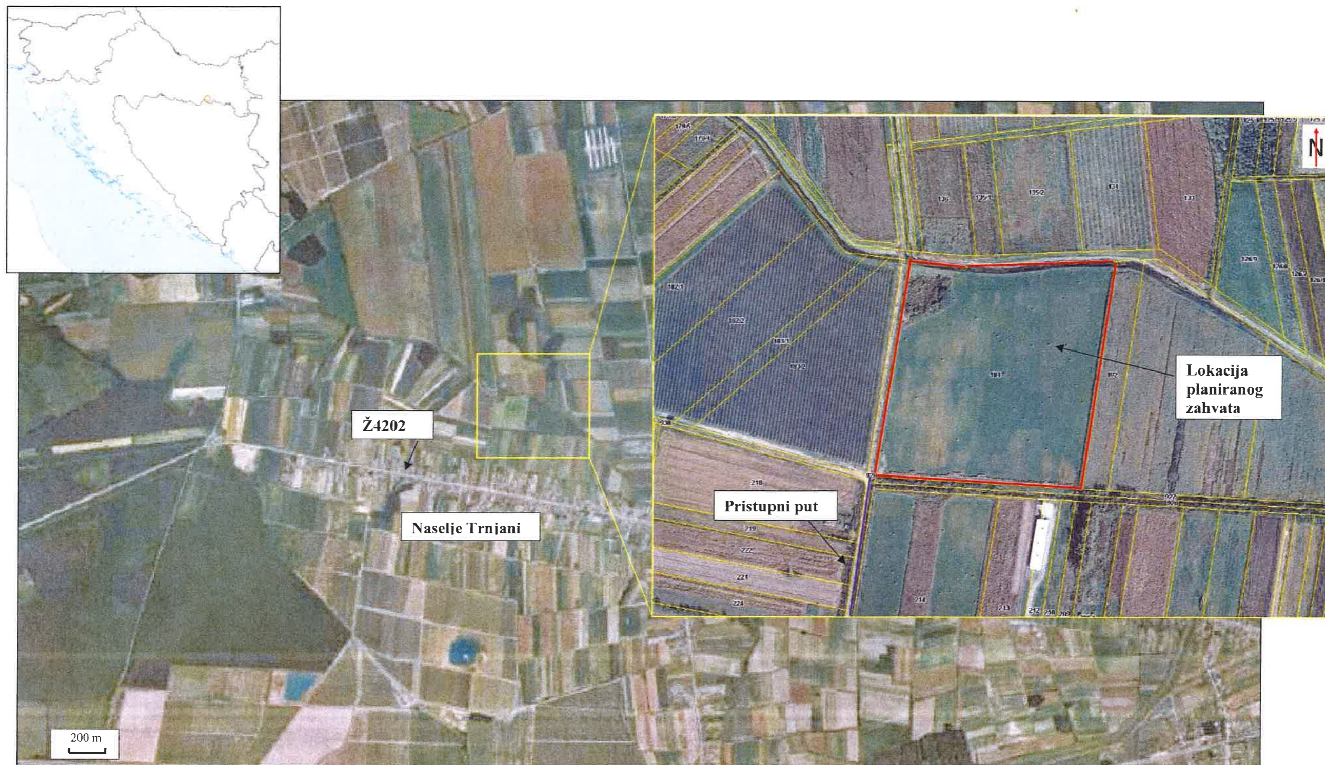
Prilog 2: Pregledna karta lokacije planiranog zahvata (Izvor: Geoportal DGU, M: 1:25 000)